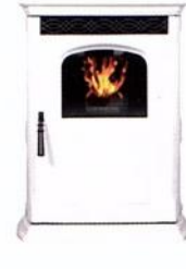
gris clair frost